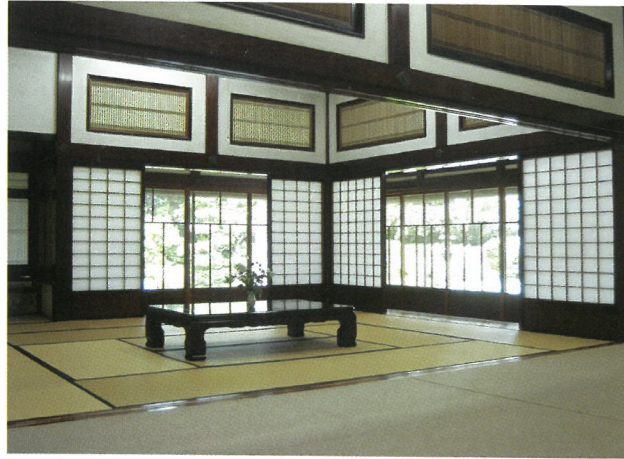
庭園を臨む大広間 (30畳)