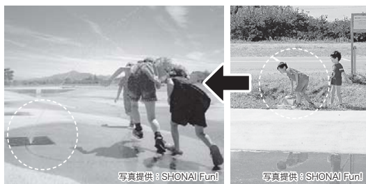
▲噴水から水が出るよ