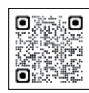
詳細は、町ホームページへ▲