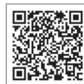
▲シンポジウムの詳細は、こちらから