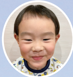
上野ときくん (横山下)