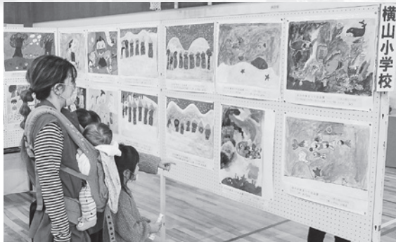
▲各小学校 作品展示