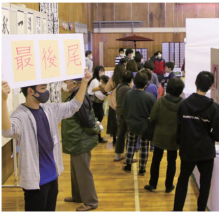
▲販売を楽しみにしていた来場者の列

日本の美意識を学ぶ授業の枠を越え、多くの人の関わりにより実現したこのプロジェクトの輪が、今後ますますに広がることを期待します。