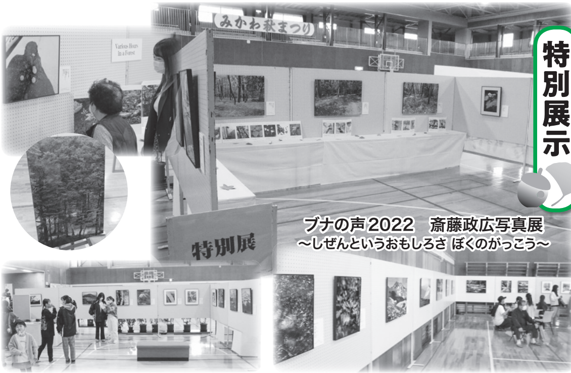
ブナの声2022 齋藤政広写真展 ～しぜんというおもしろさ ぼくのがっこう～