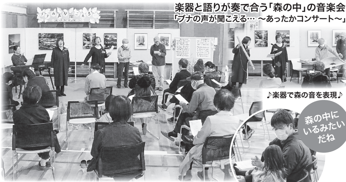
楽器と語りが奏で合う「森の中」の音楽会 「ブナの声が聞こえる… ～あったかコンサート～」