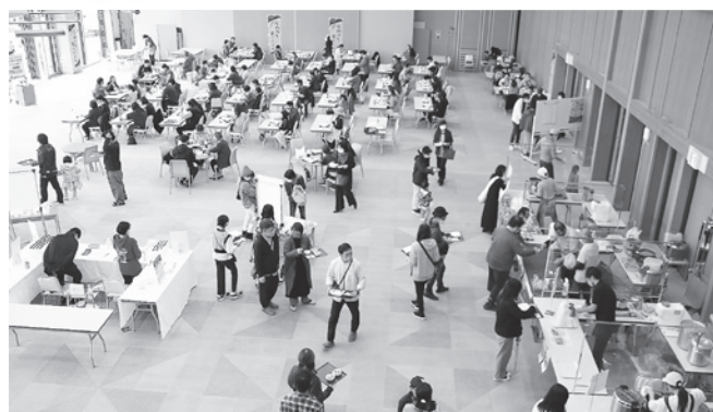
▲多くの来場者でにぎわう会場

10月30日(日)、いろり火の里なの花ホールを会場に、「庄内カレー食べくらべ」が2年ぶりに開催され、13店舗約20種類のカレーが提供されました。