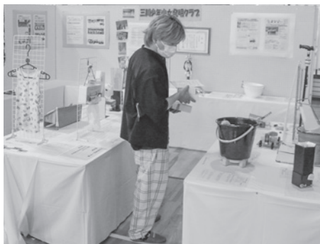
▲三川少年少女発明クラブ 作品展