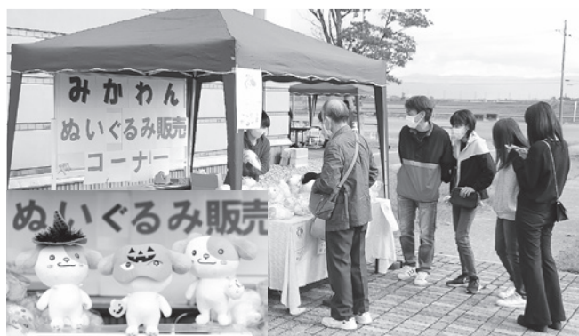
▲「みかわん」ぬいぐるみ販売(※写真左下は、仮装したぬいぐるみの展示)