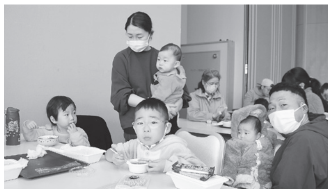
▲カレーを食べる子どもたち

また当日は、ハロウィン特別プレゼント企画で、小学生以下の子どもにはお菓子を、仮装して来場された方にはプチギフトが配られ、子どもたちの笑顔と仮装で、会場は華やかに彩られました。