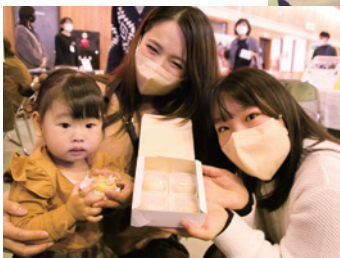
▼お目当ての和菓子を購入し、満足そうな親子