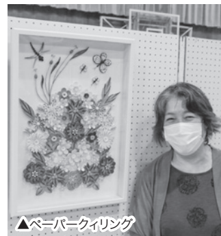
▲ペーパークィング