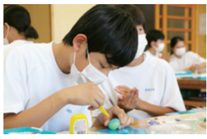
▲授業の様子 ▼竹串を使った緻密な作業

三川中学校では、毎年2年生が美術の授業で、「三川の四季」をテーマにした粘土細工の和菓子作りに取り組んでいます。完成した作品は、例年みかわ秋まつりに展示され、その精巧な出来栄に、多くの来場者の注目を集めていました。