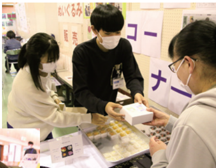
▲中高生ボランティアサークル「来夢来人」が店員となり、商品化した和菓子販売