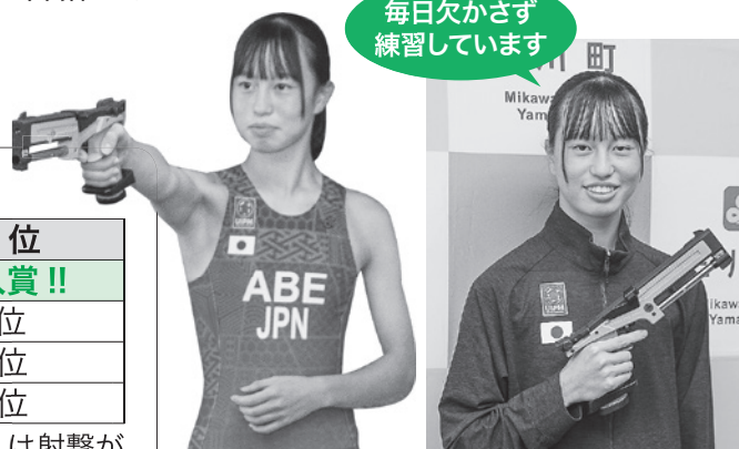
▲日本代表のユニフォーム姿でレーザー射撃を披露 競技では10m離れた直径6cmの的を狙う