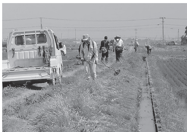
共同の草刈り作業