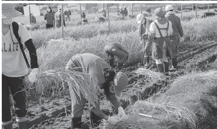
稲刈り体験(横山小)