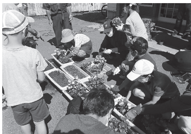
プランターへの植栽作業