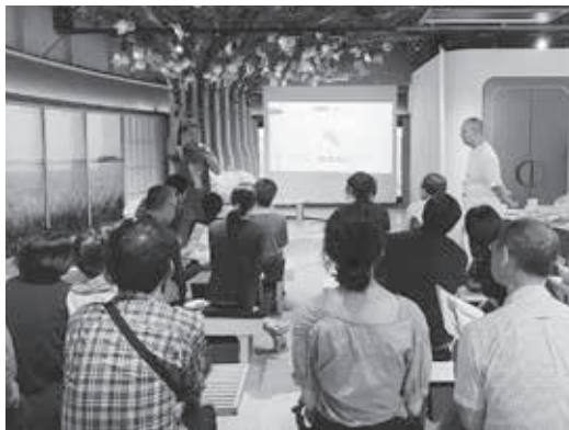
「ふるさとチョイスcafé」では全国の自治体が地域や特産品を紹介するイベントを行っています