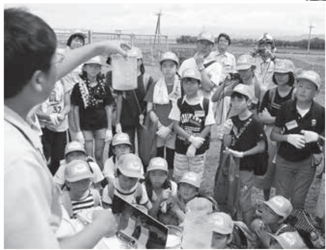
水をきれいにする実験を見学