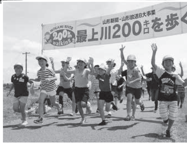
最後は笑顔でゴールを駆け抜けました

7月20日(土)、山形新聞・山形放送主催の「最上川200キロを歩く 小学生探検リレー2019」に、東郷小学校の4~6年生35人が参加しました。リレーは5月に米沢市の最上川源流域をスタートし、10週にわたり、県内各市町村の小学生たちがバトンとなるビッグフラッグをつないできました。最終週の今回、東郷小学校がアンカーを務めました。