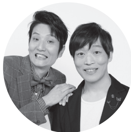
ソラシド (山形県住みます芸人)