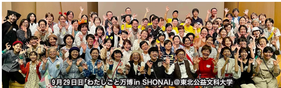
9月29日「わたしごと万博 in SHONAI」@東北公益文科大学

自分のわくわくを起点にした小さな仕事づくりが、自分を変え、周りを巻き込み、地域をポジティブに変えていくこと。消費者でしかなかった人たちがそれぞれプレイヤーになると、顔の見える経済が回り出し、地域に小銭と笑顔が循環していくこと。仲間が増えることは、セーフティネットにもなること。そんなことを再認識し、また庄内のご飯が美味しいと皆さんに感激してもらえて（笑）、感無量の1日でした。