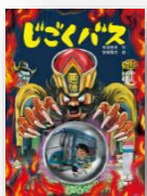
『じごくバス』 有田奈央：作