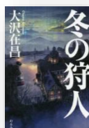
『冬の狩人』 大沢在昌：著