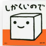
『しかくいので』 新井洋行：作