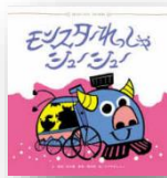
『モンスター れっしゅー しゅー』 鈴木翼：作