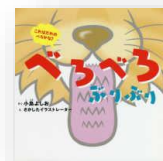
『べろべろ』 小島よしお：作