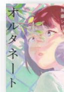
『オルタネート』 加藤シゲアキ：著