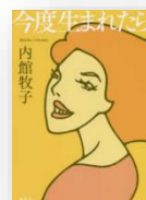
『今度生まれたら』 内館牧子：著