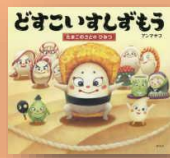
『たまごのさ とのひみつ』