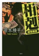
『相剋―越境捜査』 笹本稜平：著

名もなき町。ほとんどの人が訪れたことがない寂れた観光地。再び客を呼ぶための華々しい計画が進行中だった。多くの住民の期待を集めていた計画は、世界中を襲ったコロナウイルスの蔓延により頓挫。町は望みを絶たれてしまう。そんなタイミングで殺人事件が発生。犯人はもちろん、犯行の流れも謎だらけ。いったい何が起こったのか。颯爽と現れた“黒い魔術師”が、知恵と仕掛けを駆使して犯人と警察に挑む！