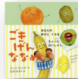
『ごきげん ななめ』 エンマ・ ヴィルケ：作