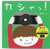
『カシャッ！』 北村人：作