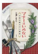
『マナーはいらない』 小説の書きかた講座』 三浦しをん：著