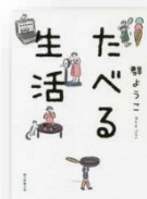
『たべる生活』 群ようこ：著