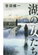
『湖の女たち』 吉田修一：著