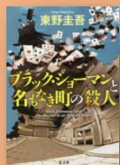
『ブラック・ショーマンと名もなき町の殺人』 東野圭吾：著

名もなき町。ほとんどの人が訪れたことがない寂れた観光地。再び客を呼ぶための華々しい計画が進行中だった。多くの住民の期待を集めていた計画は、世界中を襲ったコロナウイルスの蔓延により頓挫。町は望みを絶たれてしまう。そんなタイミングで殺人事件が発生。犯人はもちろん、犯行の流れも謎だらけ。いったい何が起こったのか。颯爽と現れた“黒い魔術師”が、知恵と仕掛けを駆使して犯人と警察に挑む！