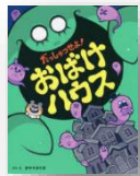
『おばけ ハウス』 カヤマタイガ：作