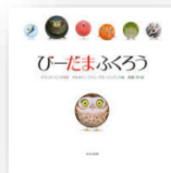
『びーだま ふくろう』 マランク・ リンク：作