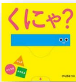
『くにゃ?』 ひらぎみつえ：作