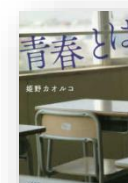
『青春とは、』 姫野カオルコ：著