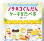
『ノラネコぐ んだん ケーキを たべる』 工藤ノリコ：作