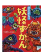
『妖怪ずかん』 よしながこうたく：作