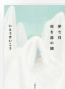
『夢七日夜を昼の國』 いたうせいこう：作