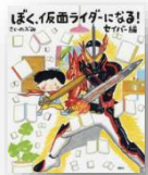
『ぼく、仮面 ライダーになる！ セイバー編』 のぶみ：作