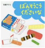
『ぼんそうこう くださいな』 矢野アケミ：作