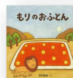
『もりの おふとん』 西村敏雄：作