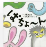
『ぽちょ〜ん』 小島よしお：作