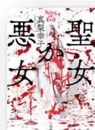
『聖女か悪女』 真梨幸子：著