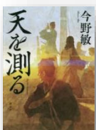
『天を測る』 今野敏：著