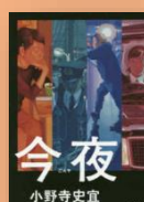
『今夜』 小野寺史宜：著

最高の出来事も、最悪な思い出も。生まれるのも、壊されるのも。人生の分かれ道は、たいてい夜に姿を見せる。ボクサー、タクシー運転手、警察官、高校教師。その夜、4人の男女は闇に侵された。人間の強さと弱さを繊細な視線で見つめ生まれた、忘れられない物語。