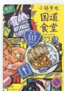
『国道食堂 2nd season』 小路幸也：著