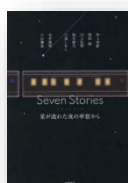
『Seven Stories』 糸井重里ほか：著