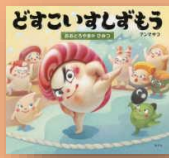
『おおとろや まのひみつ』