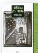
『日曜日は青い蜥蜴』 恩田陸：著