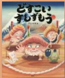
『どすこいす しずもう』