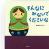
『そんなにみ ないで くださいな』 accototo：作