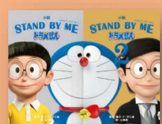
『小説 STAND BY ME ドラえもん1・2』 藤子・F・不二雄：原作