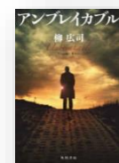
『アンブレイカブル』 柳広司：著