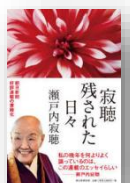
『寂聴 残された日々』 瀬戸内寂聴：著