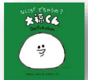
『なにがで ちゃうの？ 大福くん』 伊藤弘康：作