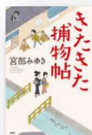
『きたきた捕物帖』 宮部みゆき：著