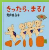
『きったら、まる!』 荒戸里也子：作