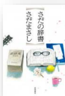
『さだの辞書』 さだまさし：著