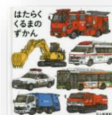
『はたらくくるまのずかん』 五十嵐美和子：作