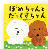
『ぼめちゃんとだっくすちゃん』 柴田ケイコ：作