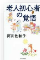
『老人初心者の覚悟』 阿川佐和子：著