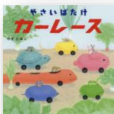
『やさいばたけカーレース』 やぎたみこ：作