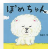
『ぼめちゃん』 柴田ケイコ：作