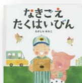
『なきごえたくはいびん』 えがしらみちこ：作

キュートでユニークな“御所人形”たちが活躍する、ゆかいなたべもの絵本ができました。読み聞かせにもピッタリです！