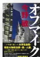
『オフマイク』 今野敏：著