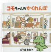
『コモチちゃんのかくれんぼ』 五十嵐美和子：作