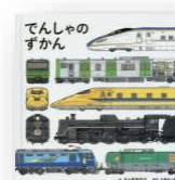
『でんしゃのずかん』 五十嵐美和子：作