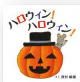
『ハロウィン! ハロウィン!』 西村敏雄：作