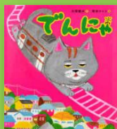
『でんにゃ』 大塚健太：作