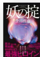
『妖の掟』 菅田哲也：著