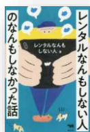
『レンタルなんもしない人のなんもしなかった話』 レンタルなんもしない人：著