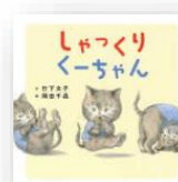
『しゅっくりくーちゃん』 竹下文子：作