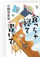
『食っちゃ寝て書いて』 小野寺史宜：著