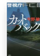
『カットバック 警視庁 FC2』 今野敏：著