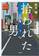
『拾われた男』 松尾諭：著