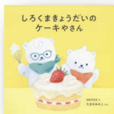
『しろくまきょうだいのケーキやさん』 たきのみわこ：作