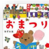
『おまつり』 あずみ虫：作