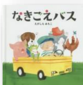
『なきごえバス』 えがしらみちこ：作