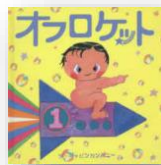
『オフロケット』 ザ・キャビン カンパニー：作

“でんにゃ”はねこの電車。がたんごとん、にやにやんにやにやん。魚屋さんでごはんを食べたり、屋根の上で昼寝したり、ねずみを追いかけたりと寄り道ばかり。目的地へ到着するのは、いったいつになることやら…。