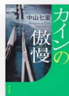
『カインの傲慢』 中山七里：著