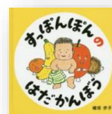
『すっぽんぼんのはだかんぼう』 植垣歩子：作