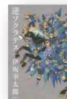
『逆ソクラテス』 伊坂幸太郎：著