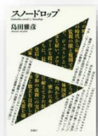
『スノードロップ』 島田雅彦：著