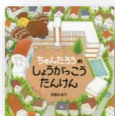
『ちゅんたろうのしょうがっこうたんけん』 田島かおり：作