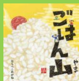
『ごはん山』 はらぺこめがね：作

ごはんが大好きな家族。今日も炊きたてのご飯を囲んでにこにこです。こんもり炊きたてごはんは、なんだか“お山”みたい。“すしが岳”“どんぶり山”…いろんな“ごはん山”に一緒に登ってみよう！