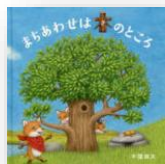
『まちあわせは木のところ』 牛窪良太：作

ごはんが大好きな家族。今日も炊きたてのご飯を囲んでにこにこです。こんもり炊きたてごはんは、なんだか“お山”みたい。“すしが岳”“どんぶり山”…いろんな“ごはん山”に一緒に登ってみよう！