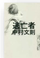
『逃亡者』 中村文則：著