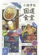
『国道食堂 1st. Season』 小路幸也：著