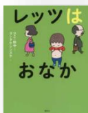
『レッツはおなか』 ひこ・田中：作