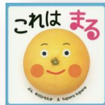
『これはまる』 中川ひろたか：作