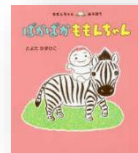
『ぼかぼかもも んちゃん』 とよたかずひこ：作