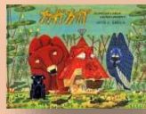
『カガカガ』 日野十成：作