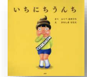
『いちにちうんち』 ふくべあきひろ：作