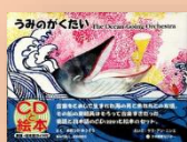
『うみがくたい』 大塚勇三：作