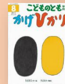
『かげひかり』 元永定正：作