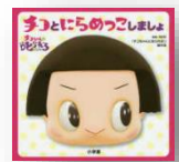
『ちこにらめっ こしましょ』 NHK：監修