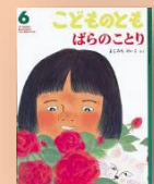
『ぼらのことり』 よこみちけいこ：作