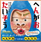
『へんがおたいそう』 鈴木 のりたけ：作