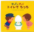
『ゆくとすく トイレでちっち』 たかてらかよ：作