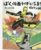
『ぼく、仮面ライダーになる！ ゼロワン編』 のぶみ：作

“へんがお”が世界を救う！つらい時や嫌なことがあった時も、“へんがお”をすれば笑顔になれる！めくって折って重ねて17の種類以上の“へんがお”ができる、おもしろしかけ絵本が登場。絵本を見ながら、動物やいろんな人の顔をまねて“へんがお”して、おもいっきり笑っちゃおう！