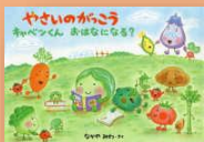
『やさいのがっこう キャベツくんおはな になる？』 なかやみわ：作

読書好きのキャベツくんは、頭に花が咲いたキャベツを図鑑で見えてびっくり！“ぼくがおはなだって!?”…。