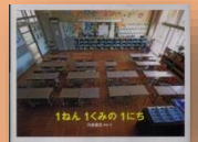
『1ねん1くみ の1にち』 川島敏生：作