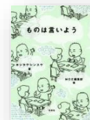
『ものは言いよう』 ヨシタケ シンスケ：作