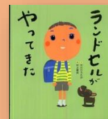
『ランドセルが やってきた』 中川ひろたか：作