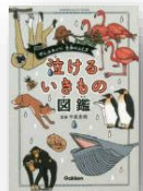
『泣ける いきもの図鑑』 今泉忠明：監修