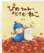
『ぴのちゃんと さむさむねこ』 松丘コウ：作