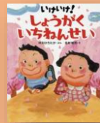
『いけいけ！ しょうかく いちねんせい』 中川ひろたか：作