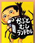
『かぶとむし ランドセル』 ふくべ あきひろ：作