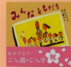
『みんな ともだち』 中川ひろたか：作