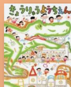
『きょうりゅう ようちえん』 のぶみ：作