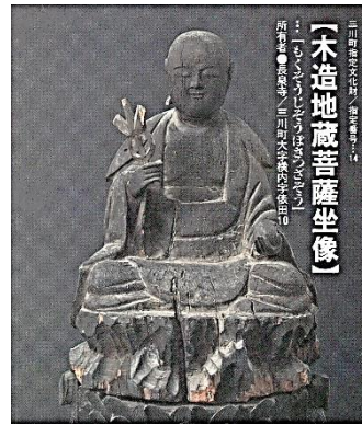
三川町指定文化財「木造地藏菩薩坐像」 所在地 長泉寺(三川町全宗本町5-10)

像と台座は1本で出来ている素地のままで、左手に宝珠、右手に錫杖(今は失う)の通形の地藏菩薩坐像です。鎌倉時代には、しばしば6頭高の幼児の像のような地藏像が制作され、円満慈悲の相好です。鎌倉時代の造頭と思われる。