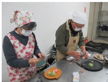
町民講座「季節の和菓子づくり」