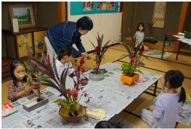
アトク寺子屋教室