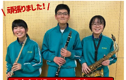
県大会出場の木管三重奏Aチーム

12月17日(日) 荘銀タクト鶴岡を会場に行われた「第52回田川地区アンサンブルコンテスト田川地区大会」に、三川中学校吹奏楽部から3チームが出場しました。管楽四重奏が銅賞、木管三重奏Bチームが銀賞、木管三重奏Aチームが金賞をそれぞれ受賞しました。木管三重奏Aチームは1月20日(土)に酒田市の希望ホールで行われる県大会に出場します。おめでとうございます!