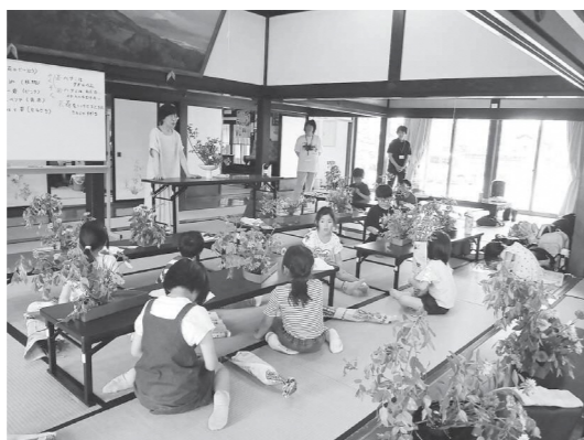
嵯峨御流による生花体験 (6月)

アトク先生の館で三回にわたり開催された寺子屋教室(三川町公民館主催)において、嵯峨御流・ほほえみ会・三川茶道会の会員が講師として活躍しました。日本の