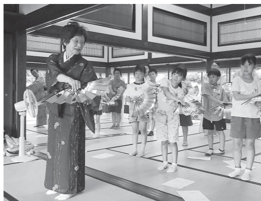
ほほえみ会による民踊舞踊体験 (7月)

伝統文化の体験指導を通して、子ども達との交流も楽しみながら、丁寧伝えていきます。