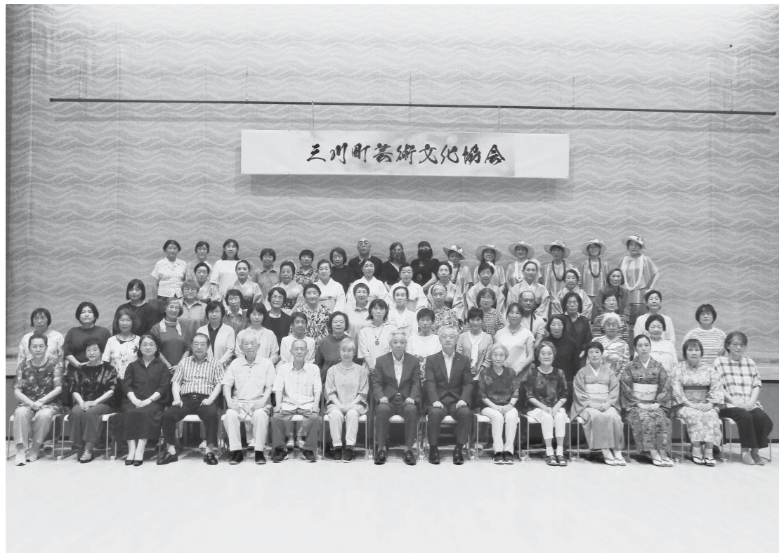
第38回 三川町芸術文化協会 会員親睦会