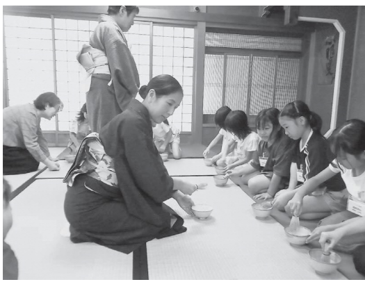
三川茶道会による茶道体験 (10月)