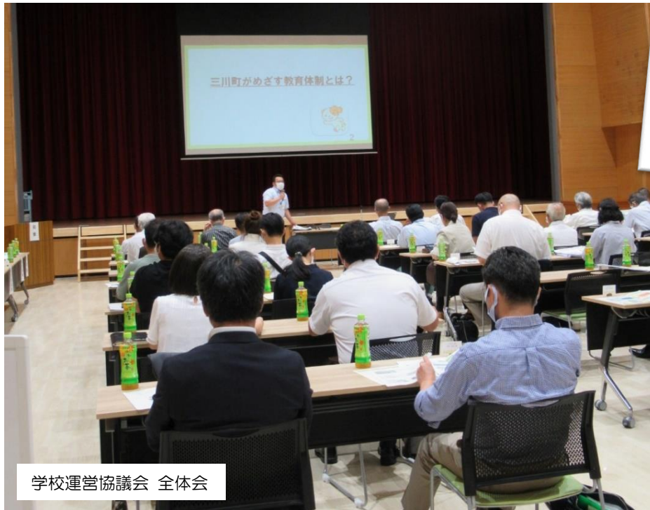
学校運営協議会 全体会