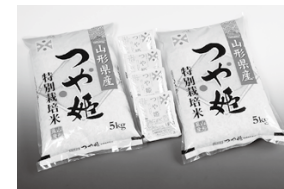
みかわと言ったらやっぱりお米! つや姫10kg+ つや姫バックライス4個

お米はもちろんのこと、野菜や果物、加工品など様々なものを返礼品として用意しています。平成29年度の申込みで人気のあった品目の一部をご紹介します。