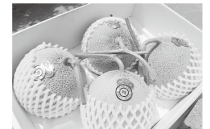
すぐに売り切れる季節限定の味! 厳選!高糖度大玉メロン