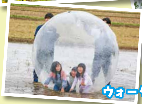
ウォーターバルーン