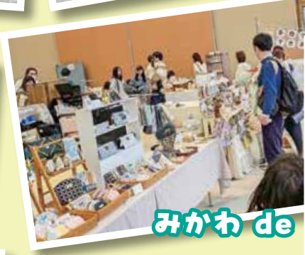
みかわ de マルシェ