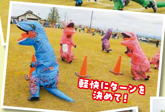
軽快にターンを 決めて!