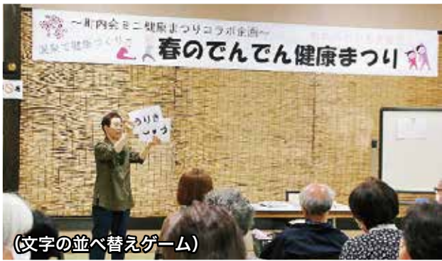
(文字の並べ替えゲーム)