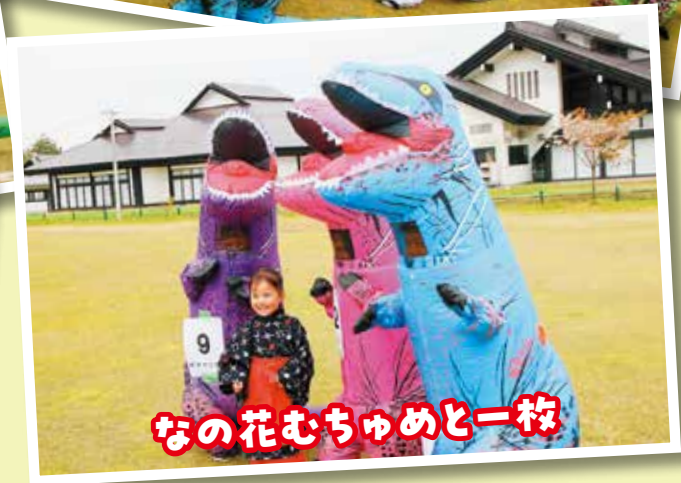
なの花むちゃめと一枚