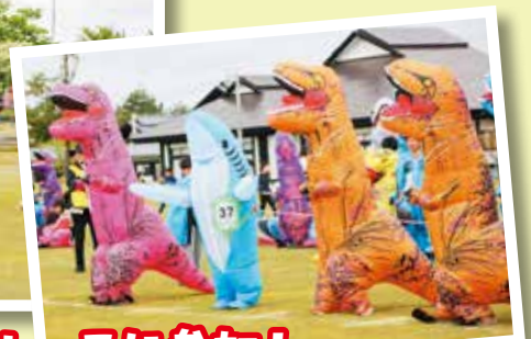
サメもレースに参加!