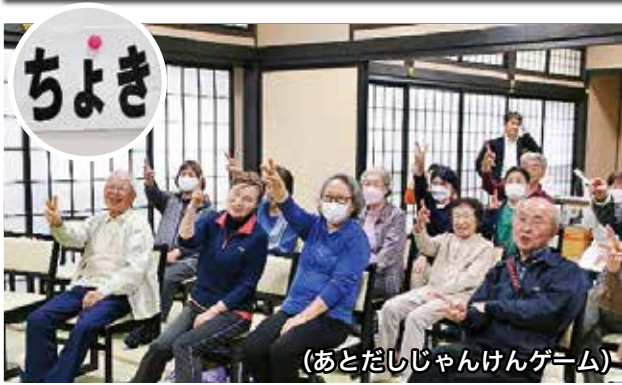
(あとだしじゃんけんゲーム)

なの花温泉田田を会場に「春のでんでん健康まつり」が開催されました。会場では、血圧測定や体組成計による健康チェックが行われました。また、ミニ講話「誰でもできて楽しい頭の体操」では、文字の並べ替えゲームやあとだしじゃんけんゲームなどが実施され、参加者たちは和やかな雰囲気の中、楽しみながらも真剣に知恵を絞っていました。