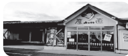
ル・パークみかわ 東側