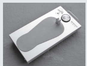
▲新登場「足指チェッカー」

○申込み・問合せ先 三川町地域包括支援センター(役場健康福祉課内) ☎ 35-7031