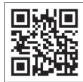
▲詳しくは、こちらから