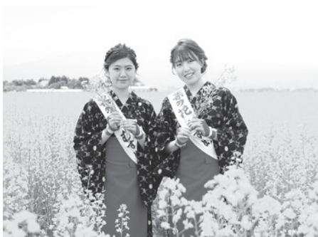
▲菜の花むすめ撮影会