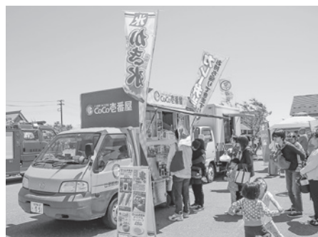
▲キッチンカー出店