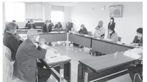
▲三川町健康・体力づくり推進協議会