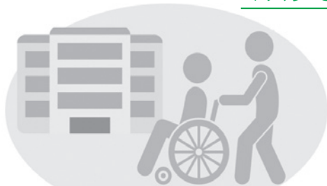
医療機関・高齢者施設などを訪問する時