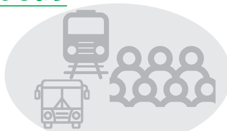
混雑した電車・バスに乗車する時