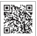
「山形庄内 U Tube」へはこちらから