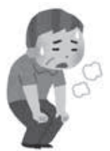
疲れやすくなった