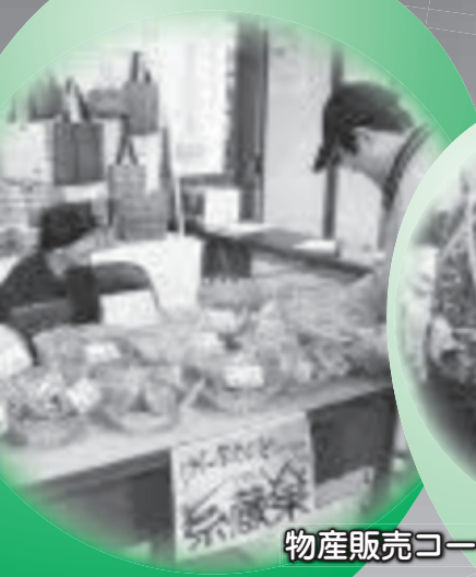
物産販売コーナー