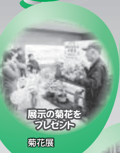
展示の菊花を プレゼント