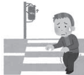
歩くのが遅くなった