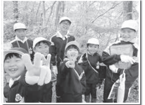
ミッション4: 全員笑顔で写真を撮る

子どもたちの成功体験が、さらに広い世界へとつながっていくこととする意欲になります。東郷小では、これからも「創る」と「つなげる」を合言葉に、子どもたちと職員が一緒に頑張っていきます。