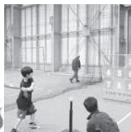
ティーボール ストラックアウト