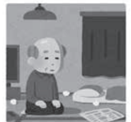
身体の活動量が減った