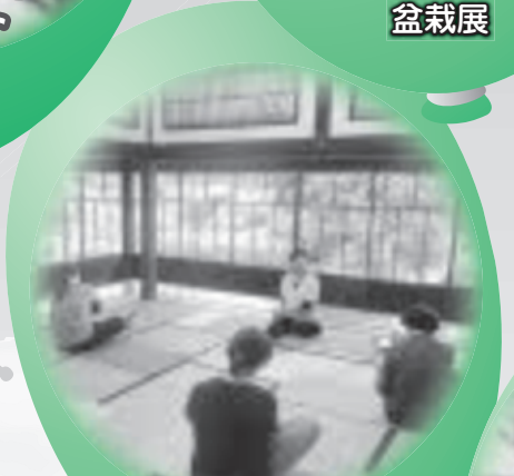
リラクゼーションヨガ