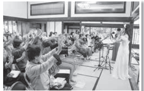
アトクすまいるライブの様子