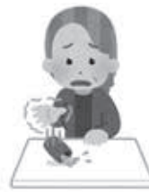
筋力（握力）が低下した

以下の5項目のうち、あてはまる項目が多い人ほどフレイルの疑いは高まるため、注意しましょう。