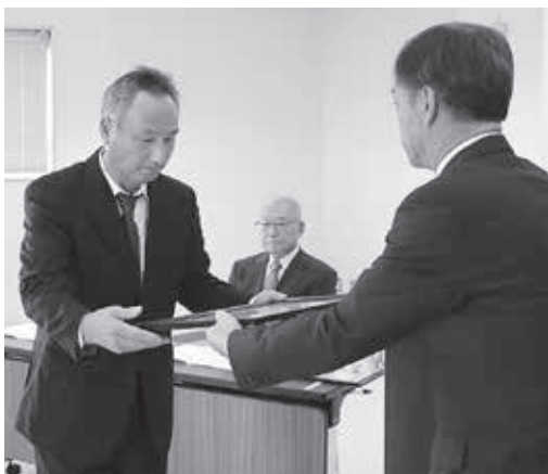
表彰式当日の様子

多年にわたり三川町農業委員会会長職務代理者並びに委員として農業の振興と地方自治の発展に大きく貢献された。