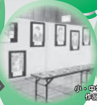
小・中学生の 作品展