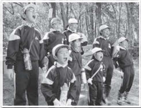
ミッション3:展望台でヤッホー

10月4日(金)には、前期なかよし班の集大成として、全校デイキャンプを行いました。この活動は、これまで交流を深めてきたなかよし班のみならず一緒に、金峯山の植物や樹木、森の生き物に触れ、自然の仕組みや営みを感じながら、