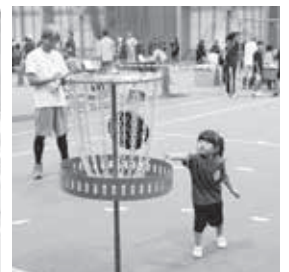
フライングディスク ターゲット