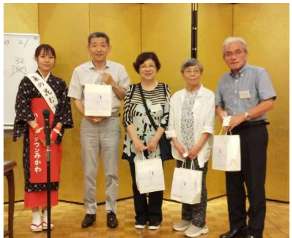
同じく3等賞ですが、つや姫。パックライスをゲットした皆さん。