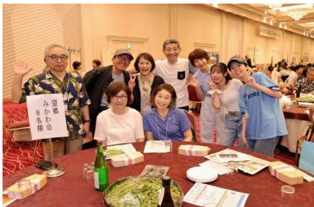
みかわ会テーブル④で7名が初参加