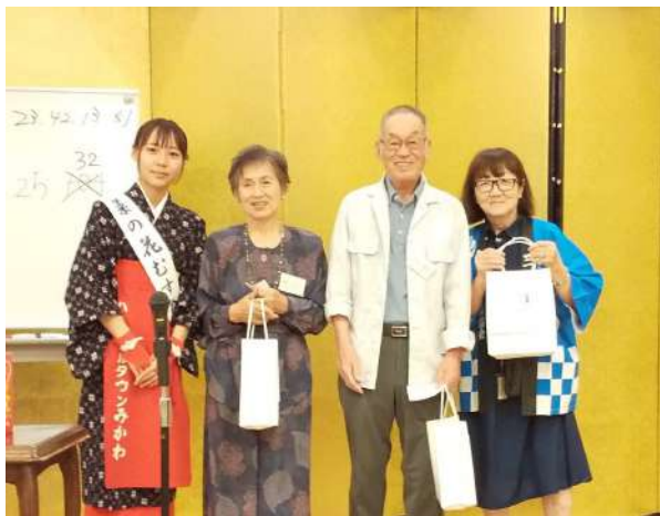
2等賞(ぶどうジュース)当選者。