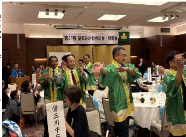
懇親会もたけなわ『三川音頭』を会場狭しと三川町役場の皆さんが中心となって踊りました。