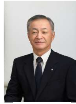
三川町 町長 阿部 誠

望郷みかわ会の皆さまにおかれましては、益々ご清栄のこととお慶び申し上げます。日頃より本町に対しまして、温かいご支援とご協力を賜り、心より御礼申し上げます。