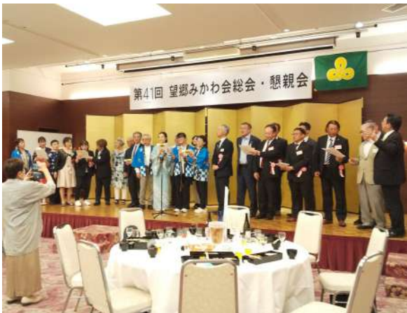
『故郷』を熱唱しました。