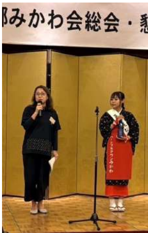
合間を利用して三川町観光協会による地酒紹介。