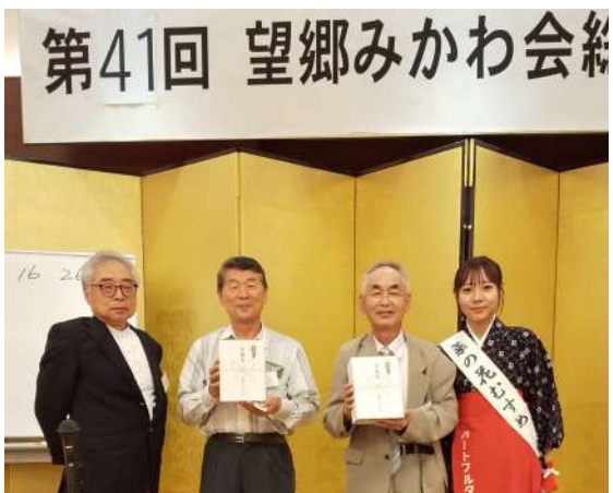
会長賞当選されたお二方です。