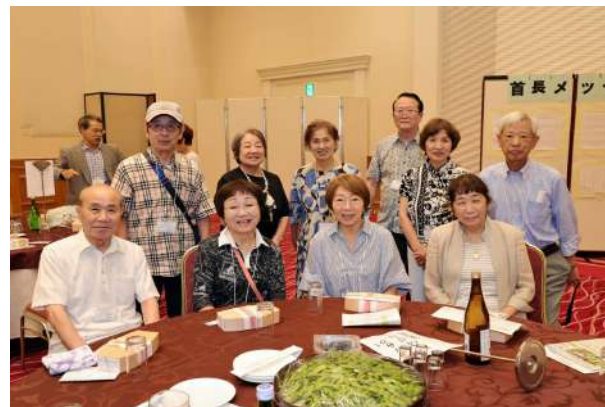
みかわ会テーブル①の皆さん