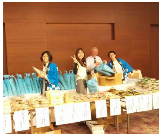
ご出席者へのお土産品袋詰め作業と物産品の販売準備状況。