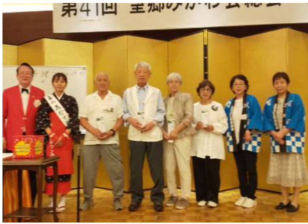
賞(古鏡)にいよいよ抽選会の時間。まずは3等賞(古鏡)に当選した皆さん。