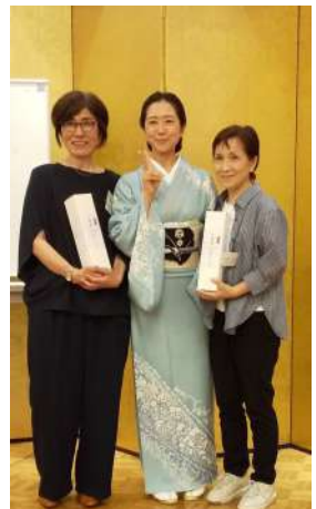
1等賞の当選者お二方です。