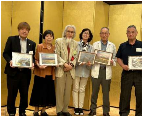
画家半澤満氏提供の特別賞。