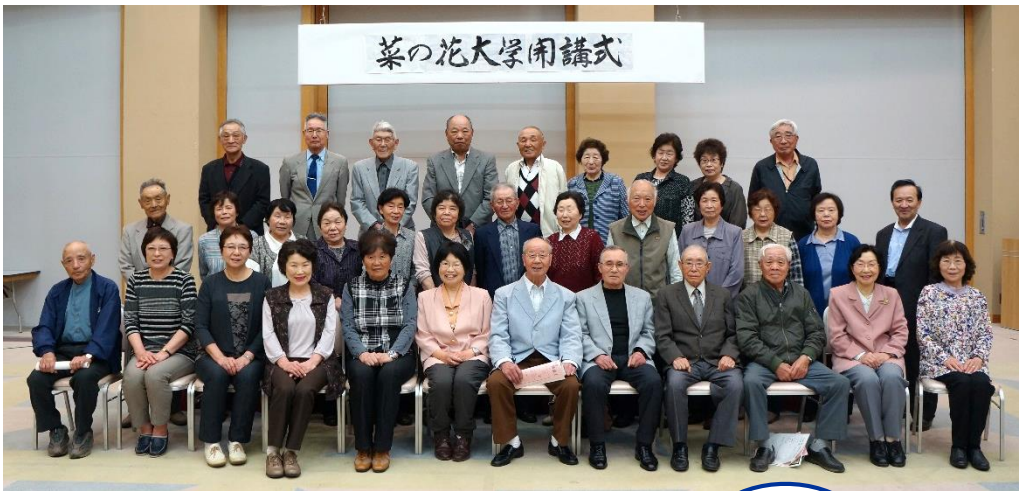
菜の花大学開講式

60歳以上を対象とした生涯学習事業の「菜の花大学」が今年度も始まり、開講式を迎えました。