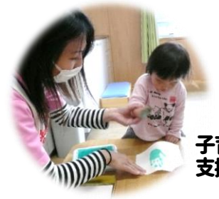
子育て 支援センター

皆さまにとって 実りある年になりますよう 職員一同、応援してまいります。 本年もテオトル、町公民館、 文化交流館をよろしく お願いいたします。