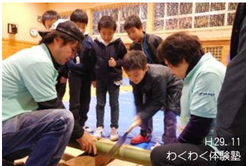
H29. 11 わくわく体験塾

「わくわく体験塾」や「親子映写会」を企画・運営し、町内の子どもたちの「生きる力」を伸ばす活動を行っています。