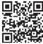
▲申請フォームはこちらから