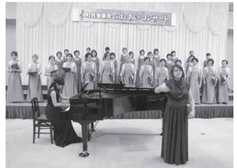
昨年の町民音楽会の様子