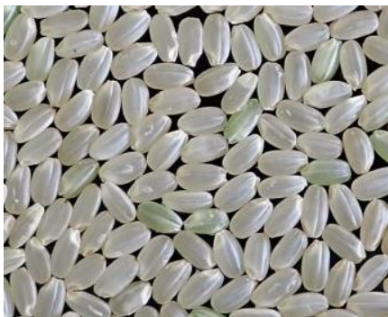
図1 9月13日現在の精玄米の状況 (鶴岡市長沼「雪若丸」) ※出穂後積算気温 997℃

胴割粒が発生しやすい登熟条件であったため、すでに軽度の胴割粒や薄く着色した茶米も見られます。刈遅れは急激な品質低下につながるため(図2)、早急に刈取りを進めてください！また、胴割粒の発生を防ぐため、籾水分が高い場合は二段乾燥や夜間休止を行うなど、 ゆっくり・丁寧な乾燥を行います。