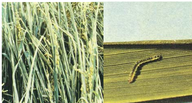
写真2 コブノメイガによる葉巻(左)と幼虫(右)