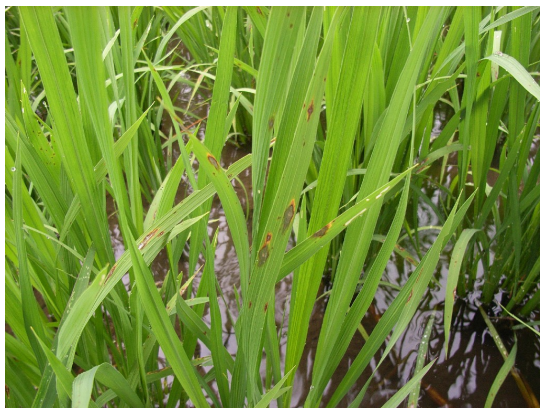
写真1 葉いもち病斑

今年も葉いもちが県内で広く確認されており、いもち病の発生速報が発表されています。 圃場をよく見回り、早期発見・早期防除に努めましょう。